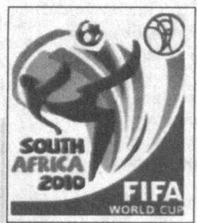
турнинг шов-шувли натижаларидан яна бири "F" гуруҳидан ўрин олган Янги Зеландия — Словакия терма жамоалари баҳсида қайд этилди — 1:1. Океания вакили жаҳон чемпионати беллашувларида бирон бир

Зиёдулла ЖОНИБЕКОВ, «Халқ сўзи» мухбири.