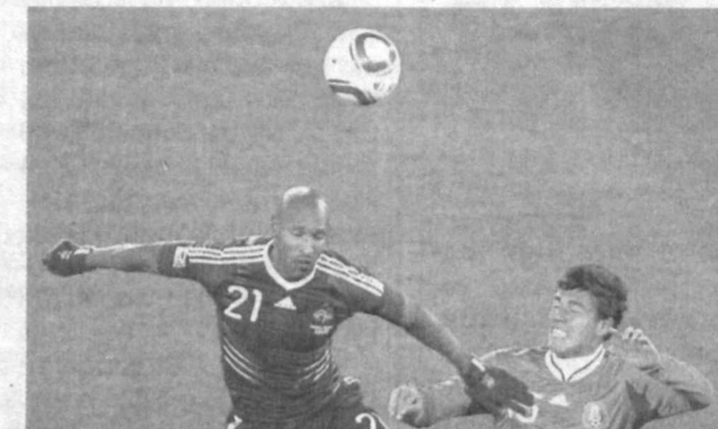
Шу кунларда майдон четидagi энг асосий машамаша Франция терма жамоаси ҳужумчиси Николья Анелька билан боғлиқ, десак, хато бўлмайдди.

Ҳозирги натижани эса қандай баҳолашга ҳам ҳайронсан, киши. Айни пайтгача қитъадоларимиз саккиз учрашувдан сўнг икки галаба, бир дуранг ва бешта мағлубият билан умумий ҳисобда етти очко жамғардилар. Тўлар нисбати эса 6-19. Айниқса, КХДР терма жамоасининг португалияликлар томонидан "янчиб ташлангани" (0:7) қитъамизда футболни ривожлантириш учун ҳали анча тер тўкиш кераклигини кўрсатади. Яхшиямки, Жанубий Корея ва Япония терма жамоаларида Нимчорак финалга чиқиш имконияти ҳозирча сақланиб турибди.