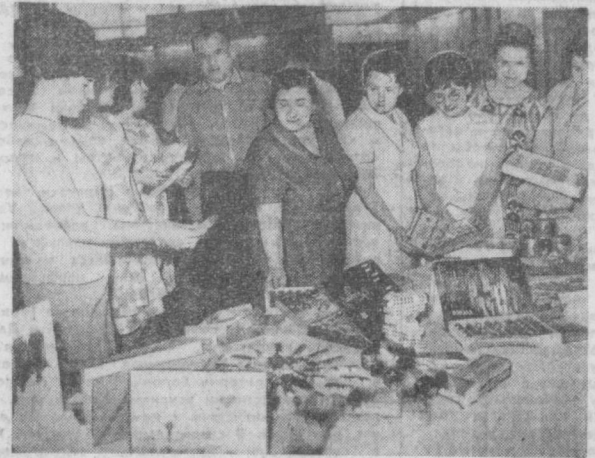
ТАШКЕНТ. НА ДНЯХ-БОЛГАРСКИЕ КОНДИТЕРЫ ПОЗНАКОМИЛИ ТАШКЕНТЦЕВ СО СВОЕЙ ПРОДУКЦИЕЙ НА ДНЯХ УЗССР. НА СНИМКЕ: на выставке.

Это пятый дом тульских умельцев, который возводится скоростными методами.