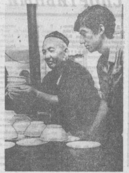
сток — верный брак. А мы стремимся, чтобы его в нашем труде не было. Коллектив завода обязался в 1968 году выпустить сверх плана 250 тысяч штук высококачественных фарфоровых изделий.

Проходя мимо одного из заводских корпусов, он остановился и взглянул девушку, которая около раскрытого окна осторожно нарисовала кисточкой искусный рисунок на палачу: — Наидля, — представил ее нам. — Моя дочь, художница. В. ЛАПИНА.