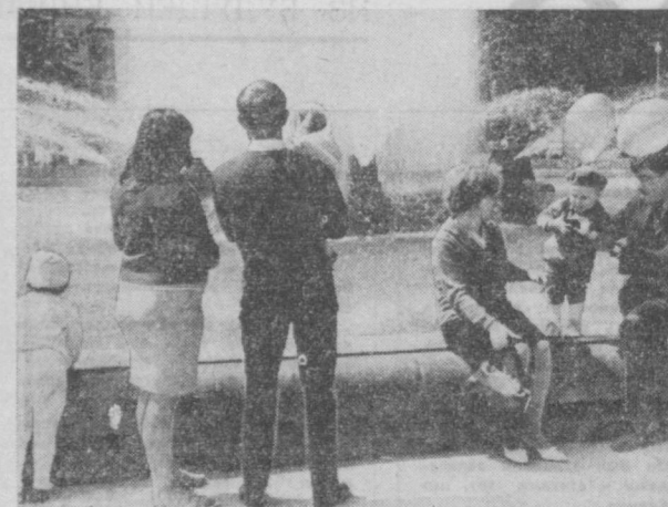
На Театральной площади всегда многолюдно. Это одно из излюбленных мест отдыха.

Краски, которые имеют лечебные свойства, создала специальная конструкторско-технологическая научно-исследовательского института городского хозяйства.