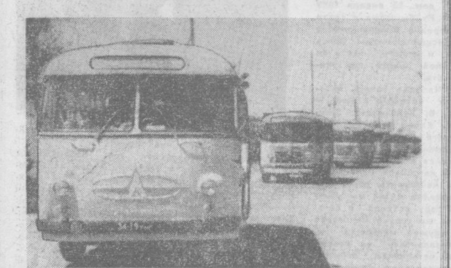
Десяти автобусов взяли в эти дни курс в пионерские лагеря.