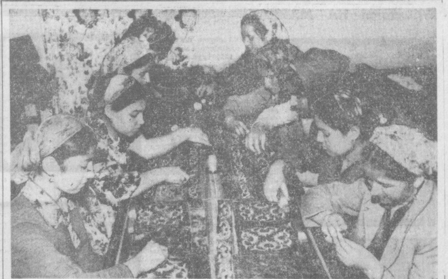
Умельцы Гиндуванского филиала Бухарской золотоспичивательной фабрики им. 40 лет Октября делают красивые, оригинальные бижутерии. НА СНИМКЕ: бригада золотоспичивательниц за работой.