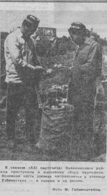
В совхозе «XXI партсъезд» Калининского района приступили к массовому сбору картофеля. Основная часть урожая направляется в столицу Узбекистана — в ларьки и на рынки.

В школах столицы и республики заканчивается учебный год. Тысячи юношей и девушек впервые сталкиваются с вопросом: как начать новый этап в своей жизни. И многие, несомненно, выберут для себя дорогу в рабочую среду. Мне хочется коротко рассказать молодежи в нашем текстильном комбинате, где пополнилось всегда рады. И где созданы все необходимые условия для получения специальности, плодотворной работы в продолжения учебы. Ташкентский текстильный комбинат — одно из самых крупных предприятий столицы Узбекистана. На его территории семь фабрик: три прядильные, две ткацкие, отделочная, ниточная. В составе комбината завод механической, электромонтажные мастерские и многие другие вспомогательные службы. Коллектив выпускает за сутки 500 тысяч метров ткани, за год — свыше 208 миллионов метров. Комбинат давно уже известен как кузница кадров. Коллектив предприятия выдвинул из своей среды много значительных людей. И действительно, здесь созданы все условия для получения высокой квалификации. Школа фабрично-заводского ученичества предприятия готовит текстильщиц различных специальностей: ровничниц, прядильщиц, ткачих и работниц других профессий. На каждой фабрике созданы курсы технического обу-