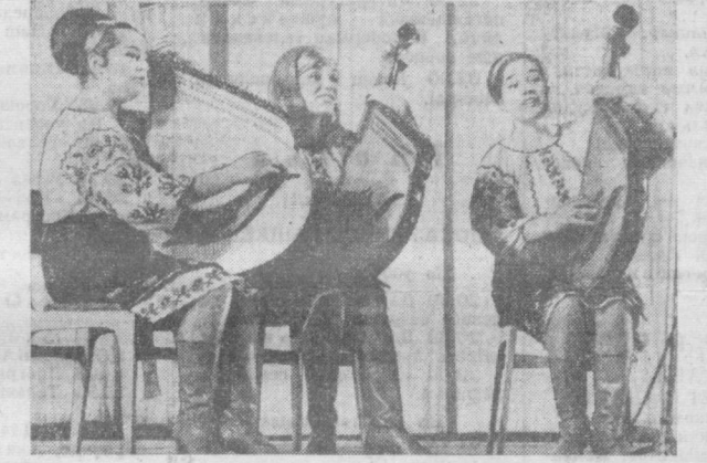
Коллективы художественной самодеятельности Советского Союза готовят и IX Всемирному фестивалю молодежи и студентов в Софии. НА СНИМКЕ: трио бандуристок (УССР) исполняет украинские народные песни.

У мужчин стреляли лучше всех также спортсмены Ташкентской области. В лич-