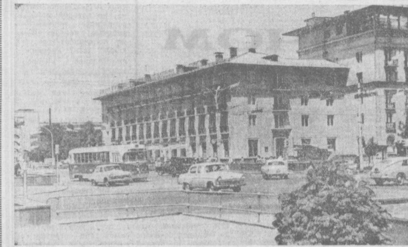
Гостиница Ташкент, Вид на улицу Узбекистанскую.