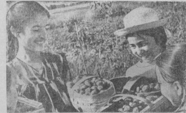
Богатый урожай клубники снимают садоводы колхоза имени Куйбышева Калининского района. Почти вся она отправляется в магазины «Ташплодотовар» для реализации трудящимся.

Потеряв в заявленной схватке 25 члудских солдат убитыми, колотворцы с территории инзиторы поспешно от-Ангелы в пределы республики Конго (Киншаса), нарушив тем членам — португальским самым суверенитет лет 50 португальских этого африканского го-солдат погибло, когда ангольские патриоты отмечаются, что погонили одну из отощедших от берега нападение на лагерь барж. ангольских беженцев в (ТАСС).