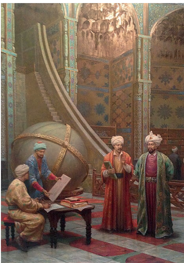
теъдод ва фаолият соҳиб Соҳибқирон Амир Темурга бундай толе ҳам насиб этганди!

Бу давр инсоният учун нимаси билан қадрли, улар инсоният тамаддуни нима берди, деган саволлар қўйилса, ана шу икки зотни эслаш кифоя. Яна бир нодир жиҳат шундан иборатки, даҳоларнинг бири (Мирзо Улуғбек) бевосита буюк давлат арбоби Амир Темурнинг тўғридан-тўғри зурриёти — набираси. Ҳамма бойлар, ҳукмдорлар авлодининг машҳур бўлишини истаиди, бироқ ҳаммага ҳам бу бахт насиб этмайди. Олмос қиррали ис-