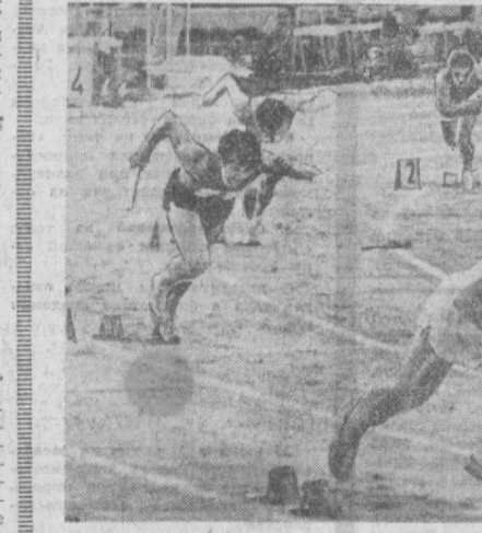
Старт эстафеты 4x100 метров.