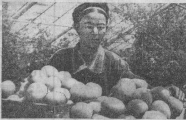
ТАШКЕНТСКАЯ ОБЛАСТЬ. Богатый урожай огурцов и помидоров снимают рабочие комбината областного треста садовниноградских и овощных совхозов.