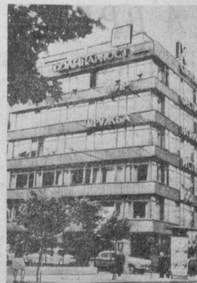
СОФИЯ. В этом здании помещается подготовительный комитет IX Всемирного фестиваля молодежи и студентов.