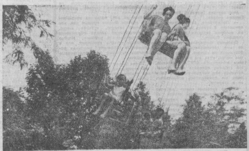
Весело и оживленно в парке имени Кирова. Особенно любят посещать этот парк дети, для которых здесь оборудованы разнообразные аттракционы.

Материалы, необходимые для выпуска новой хлопкоуборочной машины, министерством выделены. Изготовление оснастки на «Таш-