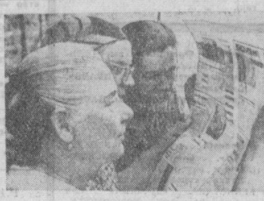
Интересно, что там пишут в газетах