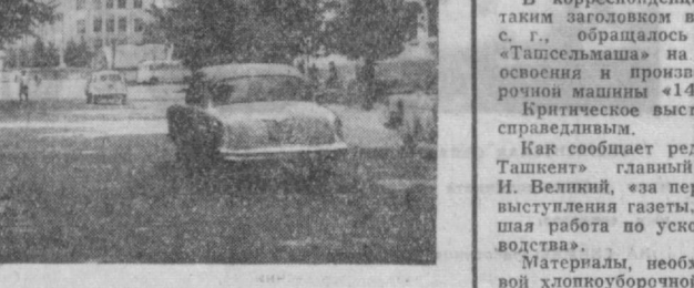
ТАШКЕНТ СЕГОДНЯ, УЛИЦА ЗАВОДСКАЯ.

Хорошо идет распродажа внешней лотереи в Узбекистане, Киргизии, Таджикистане, Эстонии, Грузии. А вот в Российской Федерации, в Азербайджане, Молдавии и Литве это дело еще не налажено. А время не ждет. Тираж олимпийской лотереи — в июле! (ТАСС).