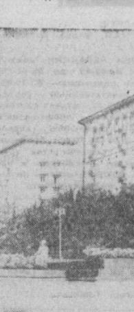
Жилые дома на Аллее Героев в Волгограде.

В бывшей Самаре, ныне Куйбышеве, крупном промышленном центре на Волге, много памятных мест. На Рабочей улице, в одном из домов — барельеф, мемориальная доска, повествующие о том, что здесь в 1890—1893 годах жил В. И. Ленин. Это был «Самарский период» в биографии Ильича, когда он вел беспощадную борьбу против народников. Здесь вел революционную деятельность соратник Владимира Ильича — Валерий Владимирович Куйбышев, с 1916 года прозванный под именем Иосифа Сталина и работавший фрезеровщиком на трубном заводе.