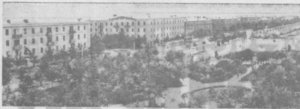
УЛИЦА ЧИРЧИК — ЛЮБИМОЕ МЕСТО ОТДЫХА ТАШКЕНТЦЕВ.