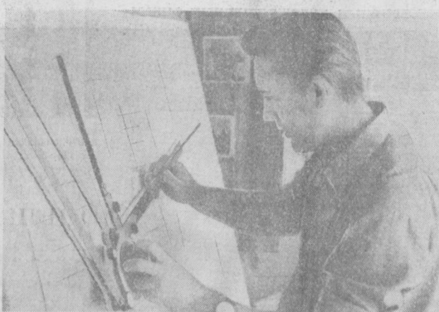
Черчивает контуры новой машины.