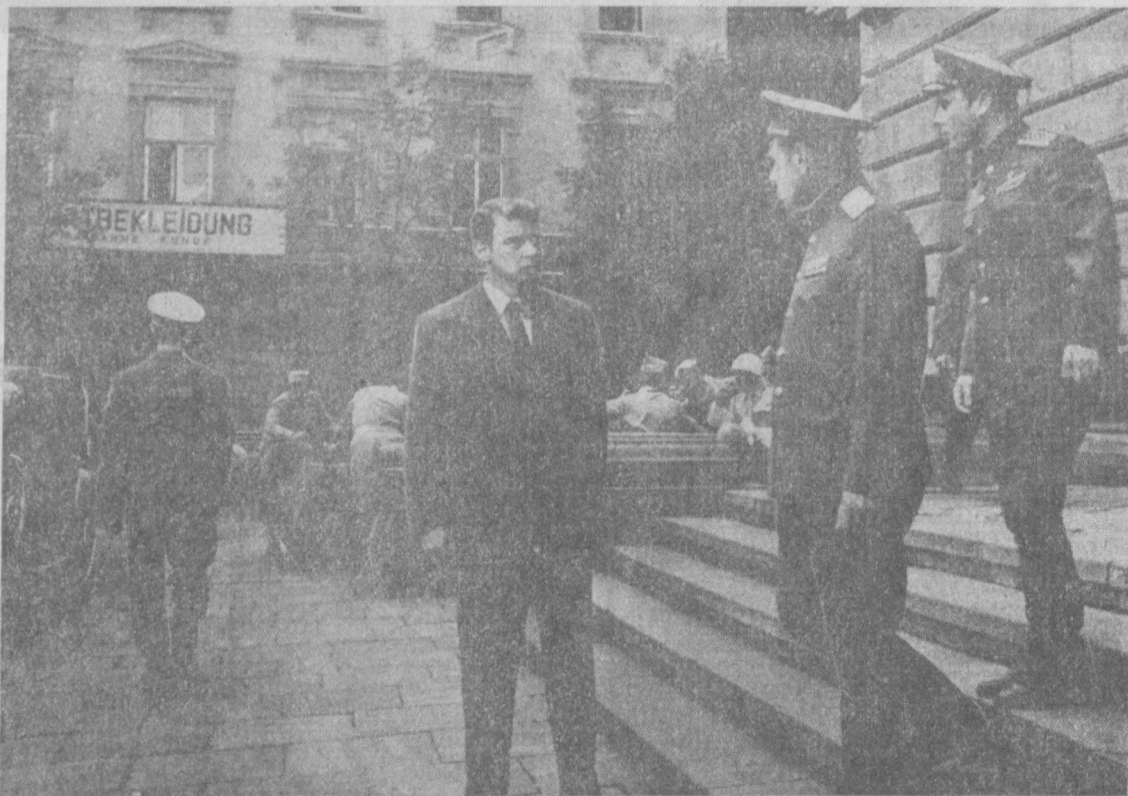
ЭТО ПРОДОЛЖЕНИЕ ФИЛЬМОВ «ПУТЬ В «САТУРН» И «КОНЕЦ «САТУРНА» РАССКАЗЫВАЕТ О РАБОТЕ СОВЕТСКИХ РАЗВЕДЧИКОВ В ТЫЛУ ПОВЕРЖЕННОЙ ФАШИСТСКОЙ ГЕРМАНИИ.