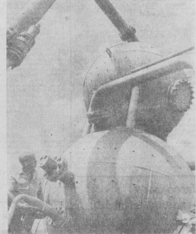
ХАРЬКОВСКАЯ ОБЛАСТЬ. Коллектив ордена Ленина Щабельинского газопромислового управления успешно выполняет обязательства, взятые в честь 50-летия образования СССР. За восемь месяцев текущего года до 93 миллиона кубометров природного газа сверх плана.

Такая газоснабжающая установка обрабатывает около пяти миллионов кубометров газа в сутки.