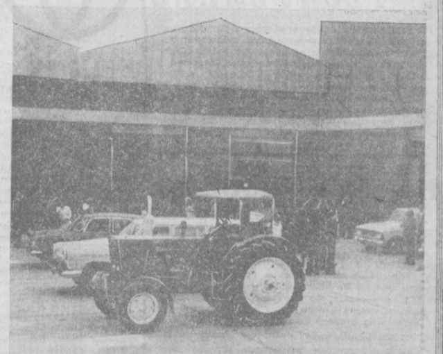
Эфиопия. Недавно в Аддис-Абебе открылся торгово-технический центр советско-эфиопского общества «ЭФСО Трейдинг».