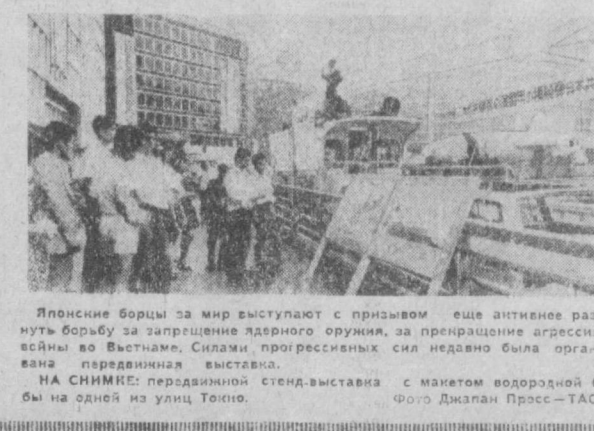
Льонские борцы за мир выступают с призывом еще активнее развлекать борьбу за запрещение ядерного оружия, за прекращение агрессивной войны во Вьетнаме. Силами прогрессивных сил недавно была организована передвижная выставка. НА СНИМКЕ: передвижной стенд-выставка с макетом водородной бомбы на одной из улиц Токио.