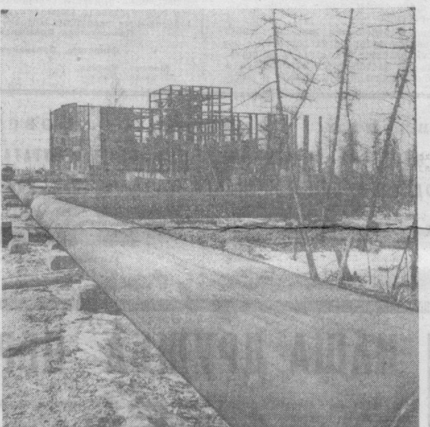
В Якутии ведется освоение новых алмазных месторождений. У са- мого Полярного круга, близ имбиритов о Я трубин «Удачная», за- канчивается строитель- ство обогатительной фабрики № 11, которая даст самые северные в мире алмазы. НА СНИМКЕ: строи- тельство обогатительной фабрики комбината «Ай- халлаба».