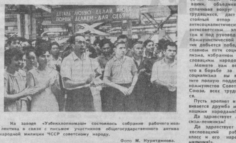
На заводе «Узбекхлопмаш» состоялось собрание рабочего коллектива в связи с письмом участников общегосударственного актива народной милиции ЧССР советскому народу.

декада узбекской литературы и искусства в Эстонской ССР.