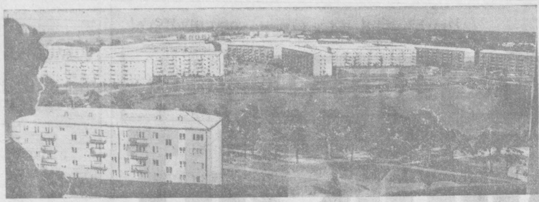
Столица Латвийской ССР — Рига. Новый жилой массив Югла-3.