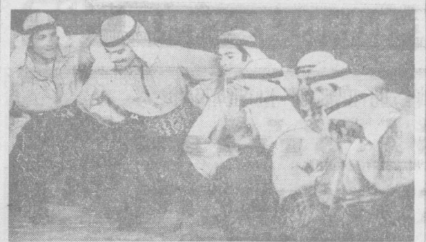
В ДНИ фестивала «Фестивал культуры и искусства»...