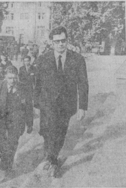
НА СНИМКЕ: гости из-за рубежа — участники конференции.

Они уже побывали в Эстонии, Тбилиси, Сочи. На этот раз их маршрут пролетает по городам Узбекистана.