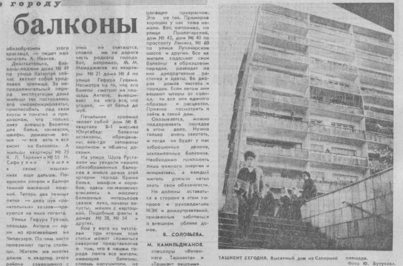
ТАШКЕНТ СЕГОДНЯ. Высотный дом на Саперной площади.

«Жилищный фонд является государственной социалистической собственностью, всенародным достоянием. Соблюдение чистоты и порядка в жилых домах, правильная эксплуатация и своевременный ремонт домов, подъездов, дворов, а также их оборудования являются общим делом всех ташкентцев».