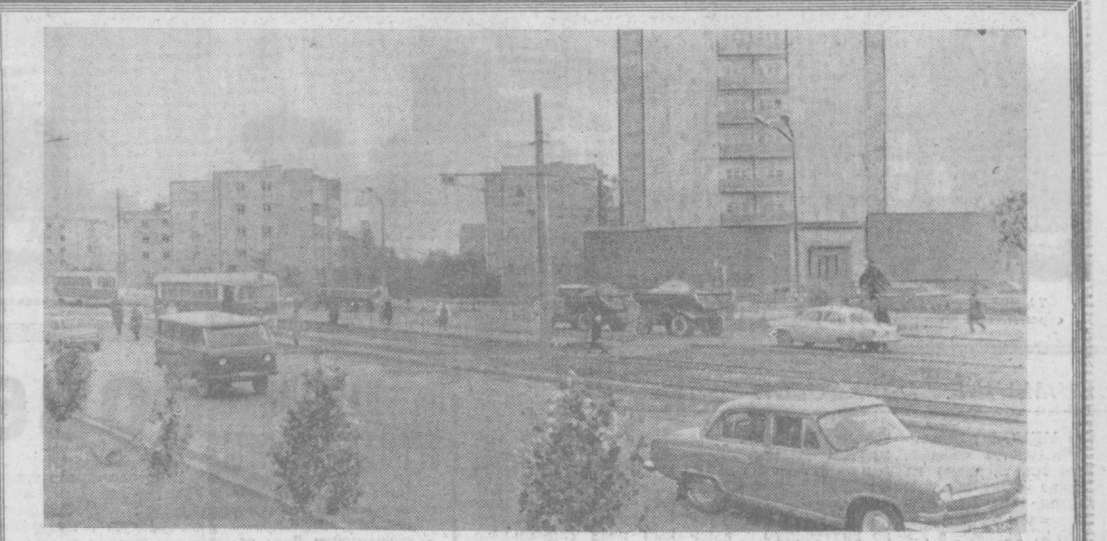
Проект М. Горького.

заявил, что авария была вызвана неполадками в тормозной системе. Катастрофа в Чикаго — самая крупная в Соединенных Штатах за последние 14 лет, но отнюдь не единственная. Согласно официальным данным, только в 1971 году в результате аварий на железных дорогах страны погибло 1,336 человек.