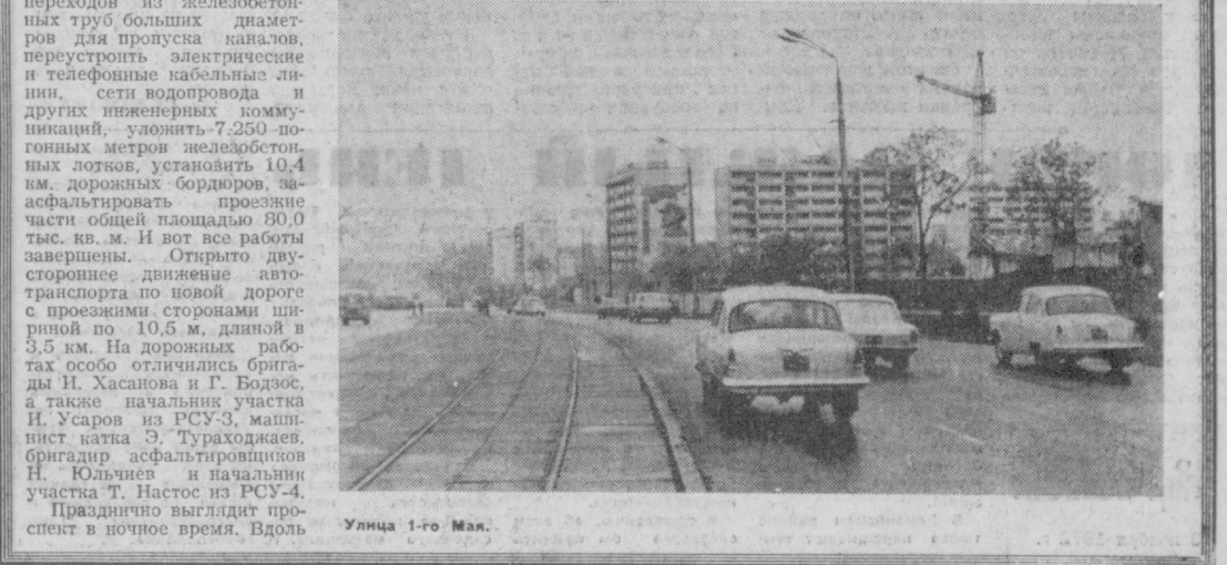
Улица 1-го Мая.

Так претворяются в жизнь планы генеральной реконструкции города, на которые на то, чтобы ташкентцам с каждым годом жилось все удобнее.