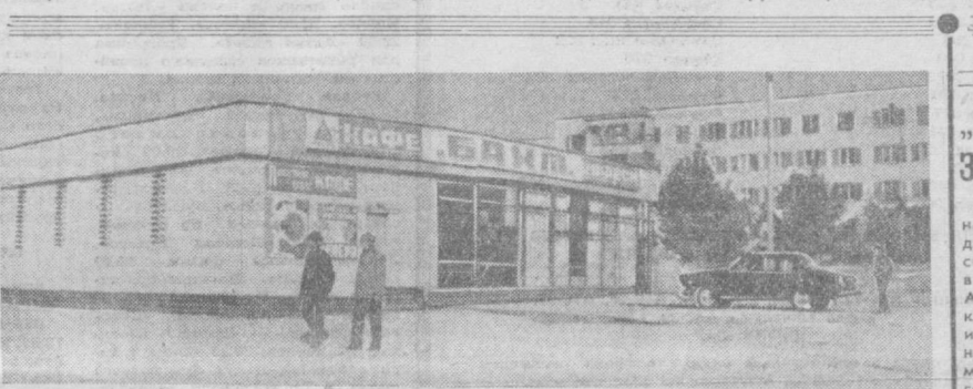
Для вас, горожане