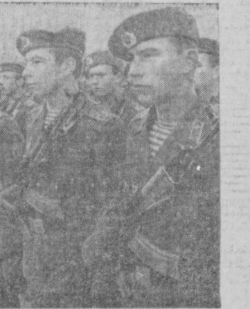
НА СНИМКАХ: ДЕМОНСТРАЦИЯ ТРУДЯЩИХСЯ ГОРОДА ТАШКЕНТА И ВОЕННЫЙ ПАРАД НА ПЛОЩАДИ ИМЕНИ В. И. ЛЕНИНА.