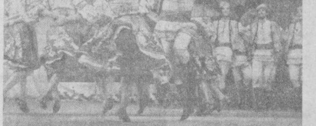
НА СНИМКЕ: в танце — танец «Молдавия».

«Юно» венчает труд земледельца. Он — символ радости, веселья, счастья.