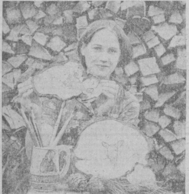
ТУРИСТЫ, побывавшие на Телецком озере, с удовольствием увозят с собой характерные для Горного Алтая сувениры. Это выжженные на пластине из капы (нароста на березе) медведи, олени, пейзажи, кедровые кружки и многое другое.