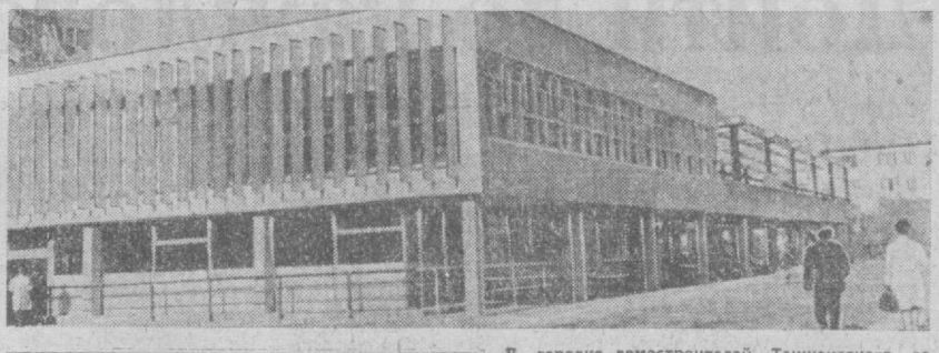
В городе демонстрируют Ташкентского домостроительного комбината недавно начал работать новый общественно-торговый комплекс. Здесь расположены магазины, кафе «Восточное», прачечный пункт и другие пункты бытового обслуживания.

в Ташкенте преобладали малооблачная погода, без осадков. Температура сегодня ночью будет 2—4 градуса тепла, днем — 13—20 градусов.