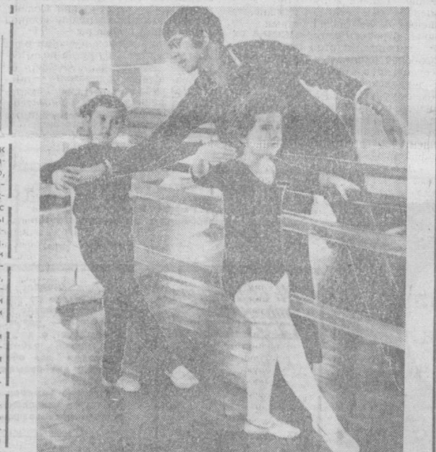
Показывает студия «Солнышко»