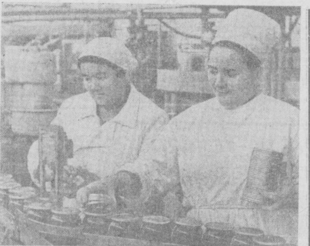
Более 29 миллионов условных банок консервов (варенье, джем, компоты, соки, маринады, халва и др.) выпустит в этом году коллектив консервного завода.

ОРГАН ТАШКЕНТСКОГО ГОРКОМА КП УЗБЕКИСТАНА И ТАШГОРСОВЕТА