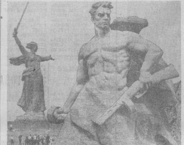
На Мамаевом кургане тишина...

Проблем немало, и решать их нужно в комплексе. Каковы перспективы развития диетического питания в городе? В новой пятилетке в Ташкенте откроются 2 диетические столовые, оснащенные современным технологическим оборудованием, — в Шахматовском доме на 100 мест, при реставрации «Заряфана» на 200 посадочных мест. Кроме того, значительно увеличится число столовых на промышленных предприятиях, в учебных заведениях, при строительстве которых будет уделено внимание организации у них диетического питания. При этом проводится опыт работы переводов коллектива диетической столовой № 1 Кировского треста столовых. М. ЖУКОВА, экономист.