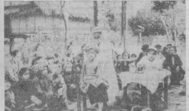
ЛАСО. Огромное внимание в освобожденных районах уделяется медицинской обслуживанию населения. Более 80 госпиталей, 85 больниц и большое количество медпунктов действуют в настоящее время. НА СНИМКЕ: идет профилактический осмотр детворы одной из деревень освобожденной зоны.

ВАРШАВА. На Гданьской судостроительной верфи им. В. И. Ленина спущены на воду рефрижератор водоизмещением 4.500 тонн. Это судно — 442-е по счету, построенное гданьскими судостроителями по заказу СССР. Кораблестроение прославил Польшу Народную Республику во всем мире. Только в текущей пятилетке предполагается сдать в эксплуатацию