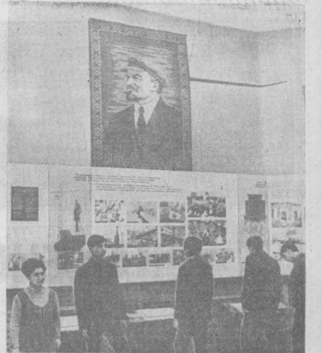
В Музее истории народов Узбекистан им. Аббаса открылась выставка «Узбекистан в братской семье народов СССР».

материалы которого раскрывают о возникновении и развитии мировой социалистической системы, миролюбивой внешней политике Советского государства, основы которой были заложены В. И. Лениным.