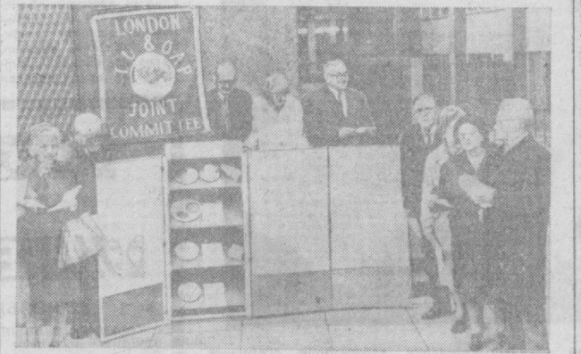
Недавно к зданию Министерства социального обеспечения в Лондоне пришла необычная процессия, состоящая из пожилых, небогатых седиными людей. Они принесли с собой обыкновенный кухонный шкаф для продуктов, медленно опустив его на мостовую, открыли дверцы. Затем женщины с исконно английской педантичностью разместили на четырех его полках более чем сиромыш рацион питания. Именно столько продуктов, сколько находилось в шкафу, может позволить себе купить в неделю пенсионер-английчанка.

XIV—XV веков, построенные в которых можно было познакомиться с древним искусством малайзийского народа. Эти работы являются лишь частью широкой программы по восстановлению и сохранению исторического прошлого страны, разработанной правительством Малайзии.