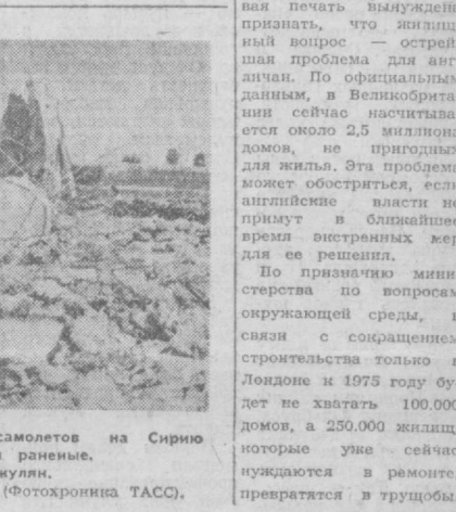
В результате бандажских налетов, израильских самолетов на Сирию разрушены многие жилые дома, имеются убитые и раненые. НА СНИМКЕ: разрушенная деревня Сахм аль-Джулиян.

БУХАРЕСТ. В Констанце и Плоешти идет строительство крупных электронно-вычислительных и центров. Оба объекта будут оснащены новейшим оборудованием. Оно позволит оперативно обрабатывать данные, помогающие принять оптимальные решения в области модернизации производства, учета сырья и других материалов, эффективного использования капитальных вложений, производственных мощностей. Широкое внедрение электронно-вычислительной техники в народное хозяйство является частью комплексной программы модернизации румынской экономики. Для новых ЭВМ только в течение этой пятилетки будет подготовлено более 28 тыс. специалистов.