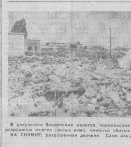
В результате бандажских налетов, израильских самолетов на Сирию разрушены многие жилые дома, имеются убитые и раненые. НА СНИМКЕ: разрушенная деревня Сахм аль-Джулиян.

БУХАРЕСТ. В Констанце и Плоешти идет строительство крупных электронно-вычислительных и центров. Оба объекта будут оснащены новейшим оборудованием. Оно позволит оперативно обрабатывать данные, помогающие принять оптимальные решения в области модернизации производства, учета сырья и других материалов, эффективного использования капитальных вложений, производственных мощностей. Широкое внедрение электронно-вычислительной техники в народное хозяйство является частью комплексной программы модернизации румынской экономики. Для новых ЭВМ только в течение этой пятилетки будет подготовлено более 28 тыс. специалистов.