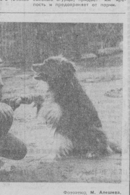
Дай лапу, друг...

Перевод с польского из журнала «Крета и жизнь». Н. ЗАРИНОВА.