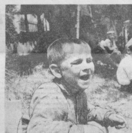
ЮНЫЙ БОЛЕЛЬЩИК ФУТБОЛА. Фотоотряд Ю. Бутусова.

Юный болельщик футбола. Фотоотряд Ю. Бутусова.