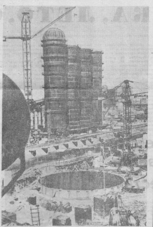
Полным ходом идет на Нижнетагильском металлургическом комбинате строительство домны-гиганта № 6.

Ее полезный объем составит 2700 кубических метров, превышая объем двух вместе взятых первых домн, построенных здесь в сороковых годах.