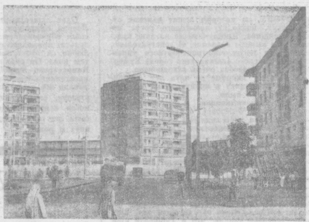
Ташкент сегодня. Площадь Антепа.