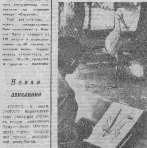
Новая авиалиния НУКУС. 5 июля. (УзТАГ). Каракалпакские авиаторы открыли новую авиалинию Нукус—Баку. Это тридцать первая воздушная трасса автономной республики. «Объектив подглядывал... Позировал анст.

СЮРПРИЗЫ КУХНИ У вас на кухне в недалеком будущем появятся электропечи. Они буквально в секунду нарежут ацидурными ломтиками колбасу, сыр. Опытные образцы такого электронного изготовлены на рижском заводе «Страуме». Еще две новинки — новые холодильники. Они «родились» в Минске. Один с камерой на 120 литров и морозильником на 80 литров, в котором можно поддерживать температуру до минус 18—19 градусов. И другой — малгаба-