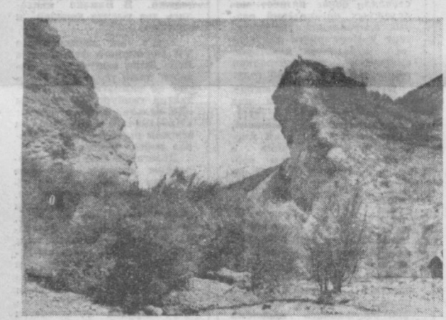
«Ворота»...