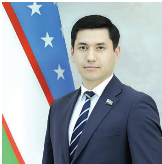
Олий таълимда грант ўринларини босқичма-босқич ошириш ҳисобига аниқ ва табиий фанлар, муҳандислик-техника, хизматлар, тиббиёт каби соҳаларда давлат буюртмаси 25 мингтага етказилди.

Сўнги йилларда замонавий фикрлайдиган, профессионал тайёрликка эга янги авлод кадрларини тайёрлаш, уларнинг ҳуқуқ ва манфаатларини таъминлаш давлат сиёсатининг энг устувор йўналишларидан бирига айланган. Ёшлар учун сифатли таълимни таъминлаш, уларни ишга жойлаштириш ва бандлиги учун шарт-шароитлар яратиш, иқтидорли ва истеъдодли ўғил-қизларни қўллаб-қувватлаш, ҳуқуқий онги ва ҳуқуқий маданиятини юксалтиришга қаратилган салмоқли ишлар қилинди. Хусусан, ўтган қисқа даврда ёшларга оид 100 дан ортиқ қонун ҳужжатлари қабул қилиниб, изчил амалга оширилмоқда. Янги таҳрирдаги Конституцияда ёш авлоднинг ҳуқуқ ва манфаатлари мустақамлаб кўйилгани Ўзбекистонда ёшларга бўлган эътиборни янги босқичга кўтариш имконини берди.