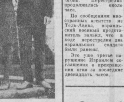
Будапешт. Костюмы участникам IX Всемирного фестиваля молодежи и студентов в Софии от Венгерской Народной Республики.

Выступивший на митинге Т. Живков дал высокую оценку строительным работам, отметил при этом, что фестивальные объекты были сооружены в исключительно короткие сроки.