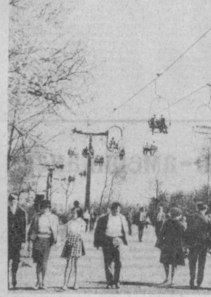
ПОЛЬША. Воздушная канатная дорога пользуется большой популярностью у посетителей парка культуры и отдыха в Хожуве.

* Имеется в виду испано-американская война 1898 года.