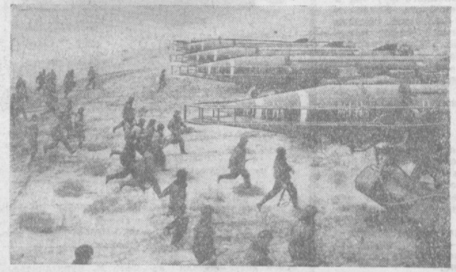
Идут тренировки, максимально приближенные к боевым условиям. По сигналу ракетки занимают места на пусковых установках.

Описывая разгром квантунской армии и империализма Японии, С. Штеменко сурово, но анализирует все процессы подготовки и проведения этой кампании: переброску с Запада войск на Дальний Восток, сосредоточение их в исходных районах, планирование наступательных операций, организацию взаимодействия сухопутных войск с Военно-Морским Флотом.