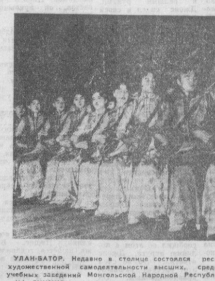
Улан-Батор. Недавно в столице состоялся республиканский смотр художественной самодеятельности высших, средних и специальных учебных заведений Монгольской Народной Республики. НА СНИМКЕ: ансамбль народных музыкальных инструментов педагогического училища Улан-Батора.

ЛОНДОН, 12 июля. (ТАСС). Израильская сторона вновь нарушила соглашение о прекращении огня и открыла сегодня пулеметный огонь по позициям иорданских войск севернее моста Муидаса через Иордан. Как сообщает корреспондент агентства Рейтер из Аммана, представитель иорданского военного командования заявил, что иорданские войска открыли ответный огонь. Перестрелка продолжалась около часа.