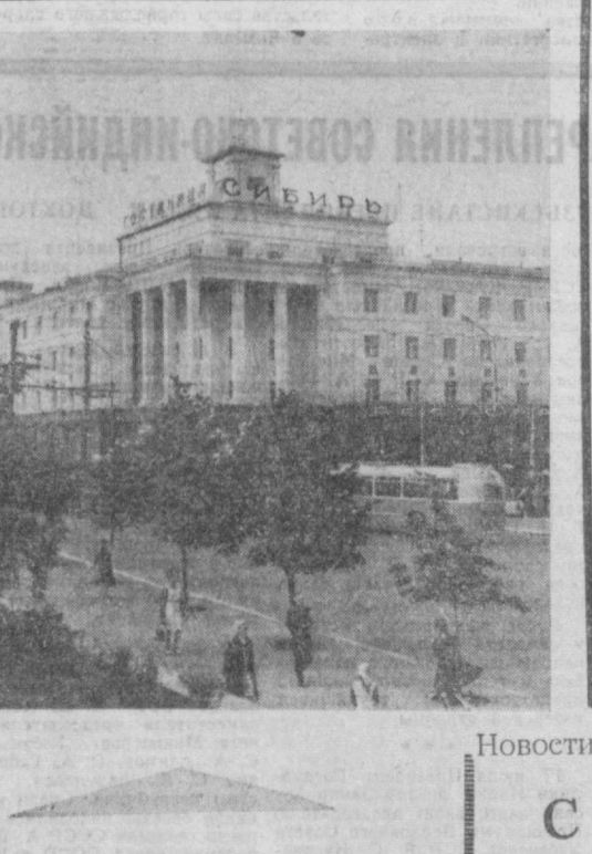
Красивые скверы, парки и сады украшают город Омск. К 1980 году на каждого горожанина будет приходиться 24 квадратных метра зеленых насаждений. В Омске установилась хорошая традиция — горожане участвуют в разбивке скверов, сажают здесь деревья, цветы. НА СНИМКЕ: на улице имени В. И. Ленина.