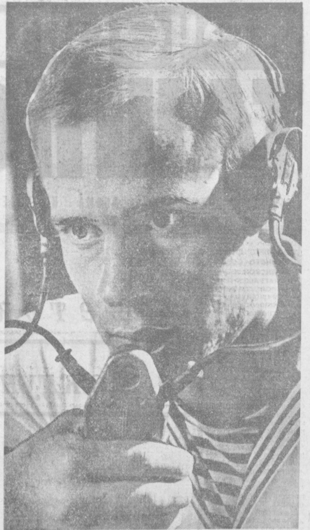
Бескрайные просторы морских границ нашей Родины. И каждую пядь их бдително охраняют парни в бескозырках. В шторм и туман чутко «слушают» границы экраны радиолокаторов, напряженно всматриваются в горизонт вахтенные. Враг не пройдет.