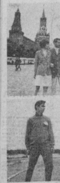
Парадная форма и тренировочный костюм спортсменов олимпийской сборной команды СССР — участники XIX Олимпийских игр в Мексике.