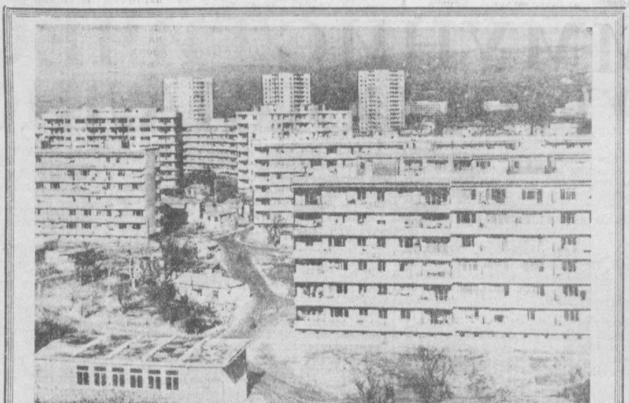
БОЛГАРИЯ. НОВЫЙ ЖИЛОЙ МАССИВ «РУПИ» — ОДИН ИЗ САМЫХ БОЛЬШИХ В ВАРНЕ.