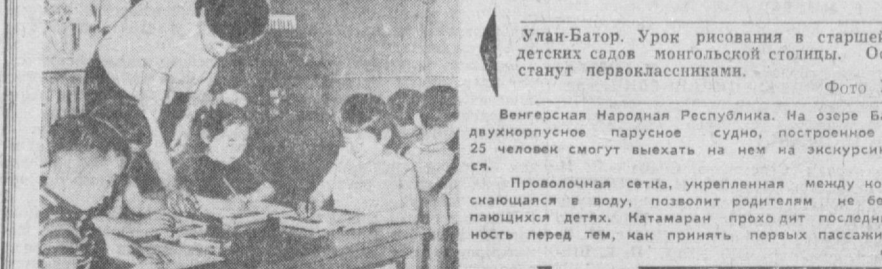
Улан-Батор. Урок рисования в старшей группе одного из детских слонов монгольской столицы. Осенью эти малыши станут первоклассниками.