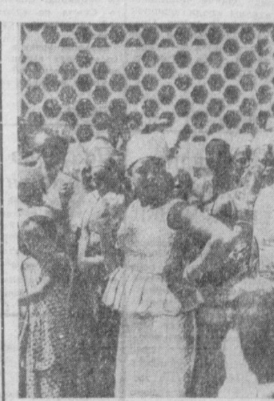
РЕСПУБЛИКА НИГЕР. НИГЕРИНСКИЕ ЖЕНЩИНЫ В ПРАЗДНИЧНЫХ НАРЯДАХ.

ТОКИО, 5 августа, (ТАСС). Сильная жара (свыше 30 градусов в тени) заставила вчера миллионы горожан выбраться к морю. На пляжах побережья Тихого океана в префектурах Канагавы и Тиба, прилегающих к столице, зарегистрировано рекордное за последние годы число посетителей Миллион с лишним человек выехали на Тихом океане в префектуру Тиба. Вчерашний жаркий день стал рекордным и по числу трагических случаев. За минувшее воскресенье на пляжах утонул 81 человек и 25 человек пропали без вести.