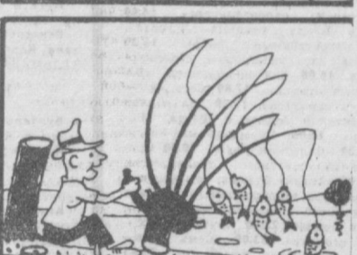
РАЦИОНАЛИЗАТОР НА РЫБАЛКЕ. Рис. Д. Синицкого.