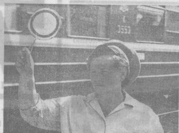
ОТЛИЧНЫМИ ПОКАЗАТЕЛЯМИ В ТРУДЕ ВСТРЕТИЛИ СВОИ ПРАЗДНИК РАБОТНИКИ СТАНЦИИ «ТАШКЕНТ-ПАСАЖИРСКОЙ». ЭТОТ КОЛЛЕКТИВ В СОЦИАЛИСТИЧЕСКОМ, СОВРЕМЕННОМ ЗАВоеВАЛ ПЕРВОМЕСТНОЕ МЕСТО В РАЙОНЕ ОТДЕЛЕНИЯ ЖЕЛЕЗНОЙ ДОРОГИ.

НА СНИМКЕ: ДЕКУРАЦИЯ ПО ПУТЯМ Р. БОРГ.