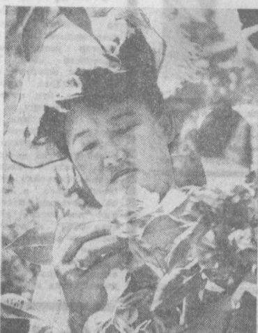
ТАШКЕНТ. Более шести тысяч видов растений насчитывает один из крупнейших в СССР ботанический сад Академии наук УзССР. Здесь представлена флора всей умеренной зоны земного шара. Научные работники сада проводят обширные исследования по разработке озеленительного ассортимента для городов и сел республики, занимаются интродукцией и акклиматизацией растений.

НА СНИМКЕ: ДЕКУРАЦИЯ ПО ПУТЯМ Р. БОРГ. Фото М. Барманова. (УзТАГ).