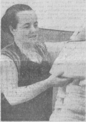
ПОСЛЕ ТОГО, КАК РАБОТА ЗАКОНЧЕНА, МОЖНО И ПОЛЮБОВАТЬСЯ ДЕЛОМ СВОИХ РУК... ШВЕД-МОТОРИСТКА СУВЕНИРНОГО ЦЕХА ТАШКЕНТСКОГО КОМПАЛАНТЕРНОГО ФАБРИКИ В. И. НИКОЛАЕВА ИЗГОТОВЛЯЕТ МОДНЫЕ ЖЕНСКИЕ СУМОЧКИ. ПЕРЕДОВИК ПРОИЗВОДСТВА РЕШИЛА ЗАВЕРШИТЬ ПЯТИЛЕТКУ ДОСРОЧНО НА ПОЛГОДА.