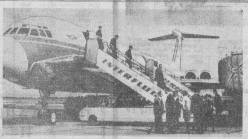
На берлинском аэродроме Шенефельд приземлился гигантский современный лайнер «ИЛ-62». Началось регулярное движение этих машин «Аэрофлота» на линии, связывающей столицу СССР и ГДР. Рассеяние от Москвы до Берлина самолет покрывает за два часа.

Во время рытья котлована при строительстве консервного завода на берегу Днестра под землей были обнаружены остатки древнего поселения. Научные сотрудники Тернопольского историко-краеведческого музея, куда сообщили о находке, установили, что город под землей не что иное, как поселение земледельско-скотоводческих племен трипольской культуры (3-2 тысячелетия до нашей эры).