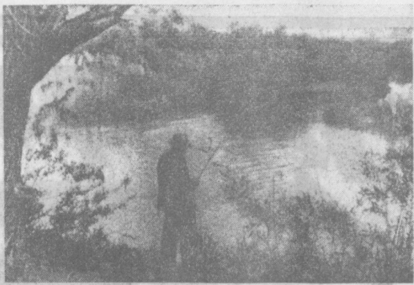
НА РЫБАЛКЕ...