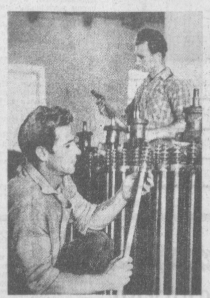
ТАШКЕНТСКАЯ ОБЛАСТЬ. Отлично ведут ремонт хлопкоуборочной техники механизаторы совхоза имени «Пятилетия УзССР». К 25 августа они обязаны полностью закончить ремонт техники.

Автоматические линии по переработке длинного волокна кенафа внедрены на каждом втором лубзаводе республики. Новая техника повышает производительность труда на пятнадцать процентов. При этом облегчается труд рабочих и улучшается качество выпускаемой продукции.