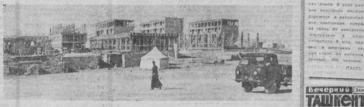
СИРИЙСКАЯ АРАБСКАЯ РЕСПУБЛИКА. На месте деревни Табка строится новый город гидростроителей Евфратского комплекса.

«Жить учиться и работать по-социалистически» — этот лозунг становится все более популярным в Народной Монголии в результате широкого развертывания движения за социалистический труд в настоящее время в стране насчитывается 2600 бригад социалистического труда и 2300 бригад борются за это почетное звание. 700 социалистических товариществе интеллигенции помогают участникам движения повысить общеобразовательный уровень, организовать культурный быт и отдых. (ТАСС).