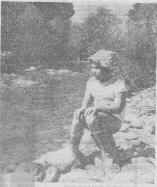
КИРГИЗИЯ. ИССЫК-КУЛЬ. СЕМЕНОВСКОЕ УЩЕЛЬЕ.