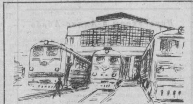
ТАШКЕНТСКОЕ ТЕПЛОВОЗНОЕ ДЕПО. ОТРЕМОНТИРОВАННЫЕ ТЕПЛОВОЗЫ ГОТОВЫ В ПУТЬ. Рис И. Меламед.

Совет потребовал от руководителей торгового комитета принять все меры к тому, чтобы наиболее полно удовлетворить потребность горожан в прохладительных напитках, квасе, пиве, мороженом. В этих целях разработаны и утверждены мероприятия. Выполняя их, уже к концу июля в городе было установлено дополнительно 35 автоматов по продаже газированной воды и 15 квасов.