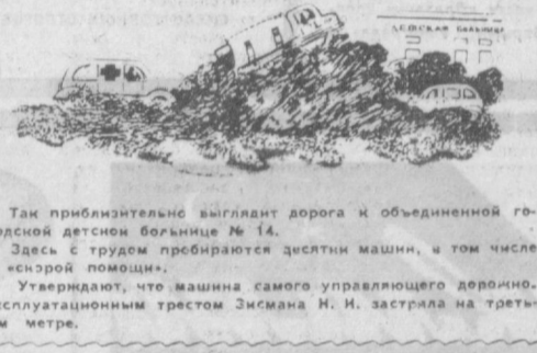
Так приблизительно выглядит дорога к объединенной городской детской больнице № 14. Здесь с трудом пробираться десятки машин, и том числе и «серой помощи».