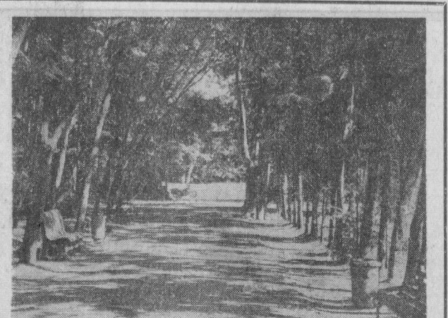
В ТАШКЕНТСКОМ ДЕНДРОПАРКЕ.