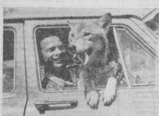
ЛИЦОМ К ЛИЦУ С ПРИРОДОЙ