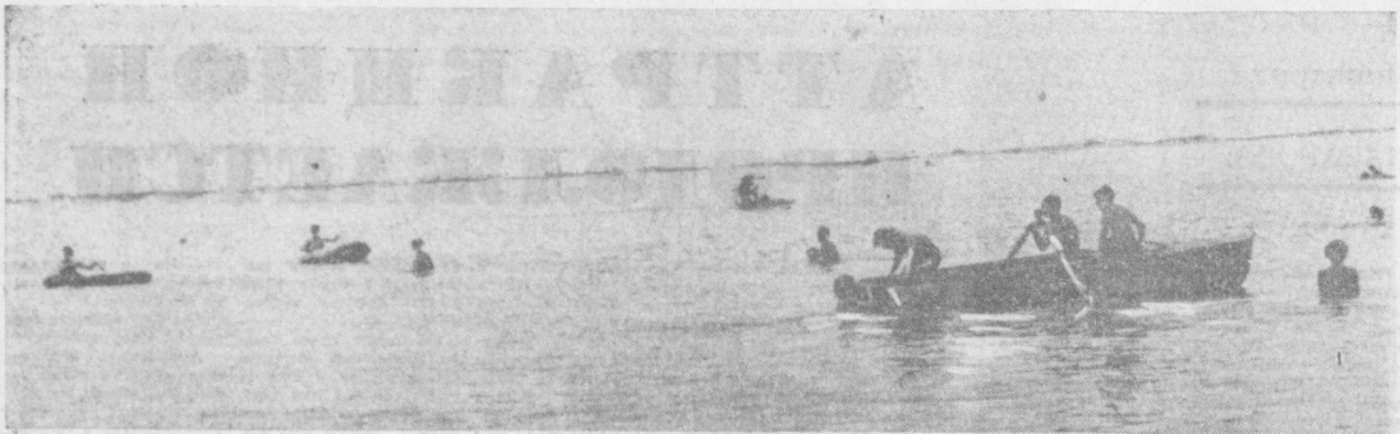
Озеро "Рохат" стало одним из любимых мест отдыха горожан. По субботам и воскресеньям сюда приезжают тысячи трудящихся Ташкента, чтобы покататься на лодках, поглотить, набраться сил перед новой рабочей неделей. НА СНИМКЕ: один из уголков озера в выходной день.