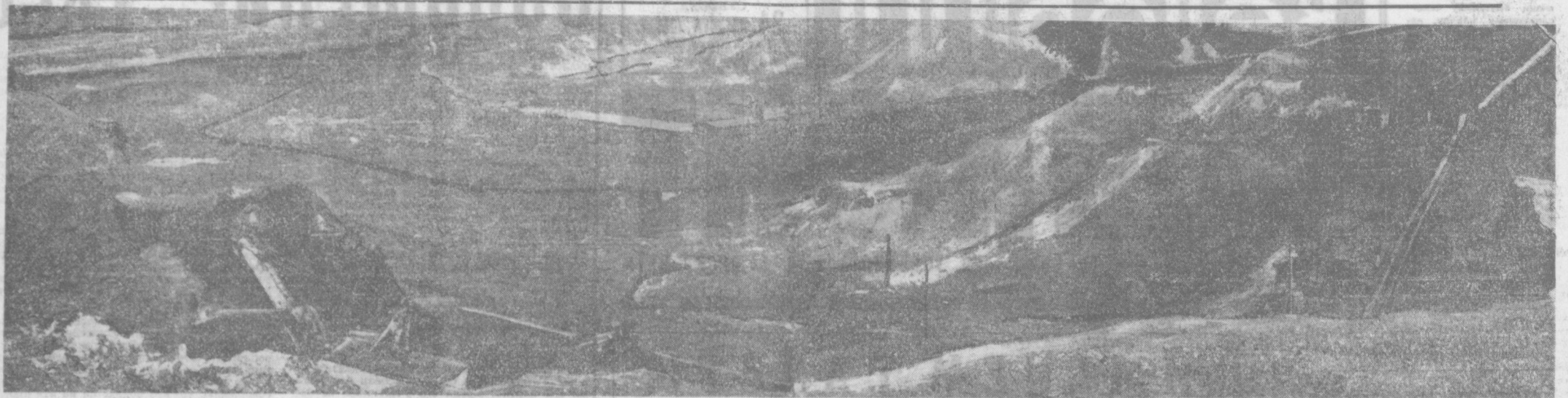
Ташкентская область. Коллектив Ингресского угольного разреза в честь столетия со дня рождения В. И. Ленина обязался к концу пятилетки добыть сто тысяч тонн сверхпланового угля, а в этом году его будет добыто сверх задания.