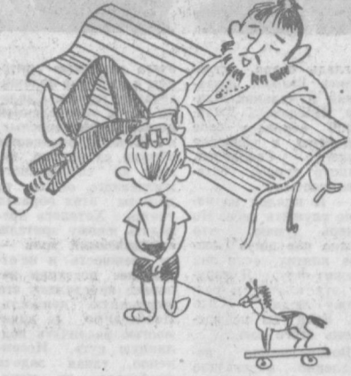
— Дяденька, подвиньтесь, я сяду! — Проживи до моих лет — успеешь насидеться...