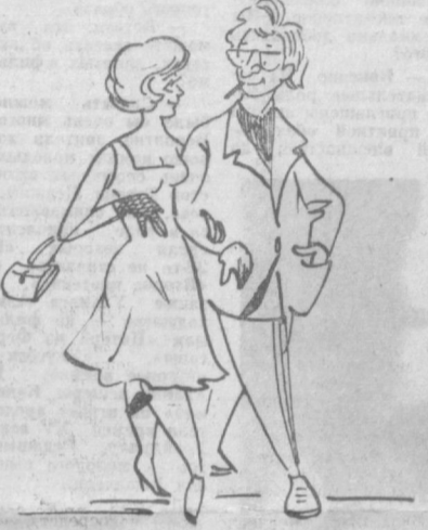
Молодой писатель со своим новым романом.