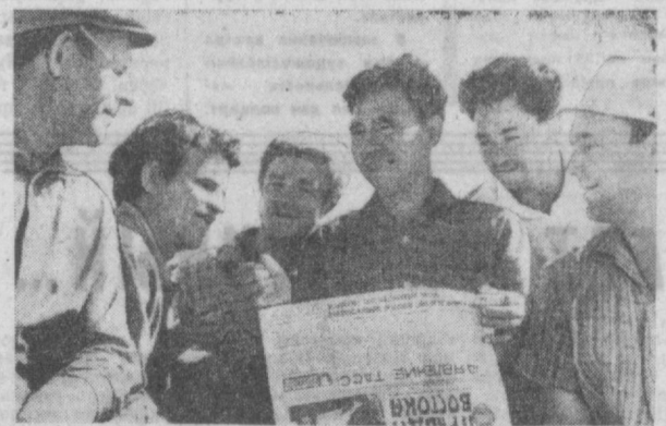
Горько одобряем решение нашего правительства. — Говорят рабочие стройуправления № 46 по адресу № 5 Главташкентстрой, знаясь с очередным сообщением ТАСС.

Мой отец погиб за освобождение Чехословакии от титловцев. Поэтому для меня было особенно больно читать на этой газете о том, как распоясались антисоциалистические элементы при поддержке империалистов все сильнее угрожают государственному строю республики.