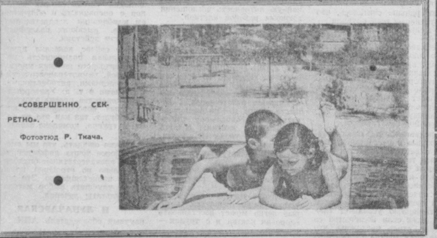
«СОВЕРШЕННО СЕКРЕТНО» Фотохудож. Р. Тичача.