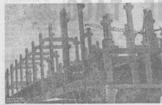
Их рабочее место — высота. Участок — строительная площадка почтамта-сортировочного. Отсюда широко открывается панорама Ташкентского вокзала, бегущие по рельсам поезда...

Вот передовые машинисты башенного крана В. Кабулов и В. Муха, работающая в строительном поезде № 295 Среднеазиатской железной дороги. Они выполняют свои сменные задания на 120—130 процентов. Танал уж у них профессия — быть на высоте, потому что она — их родная стихия.