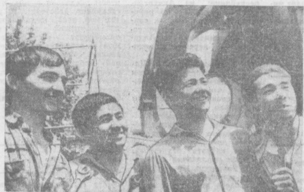
ОДНОЙ ЗАБОТОЙ ЖИВУТ ЭТИ ЛЮДИ — ДОСТОЙНО ВСТРЕТИТЬ СТОЛЕТИЕ СО ДНЯ РОЖДЕНИЯ В. И. ЛЕНИНА. В КОЛЛЕКТИВЕ ЗАВОДА «ТАШСЕЛМАШ» ИХ УВАЖАЮТ, К ИХ СОВЕТАМ ПРИСЛУШАЮТСЯ.