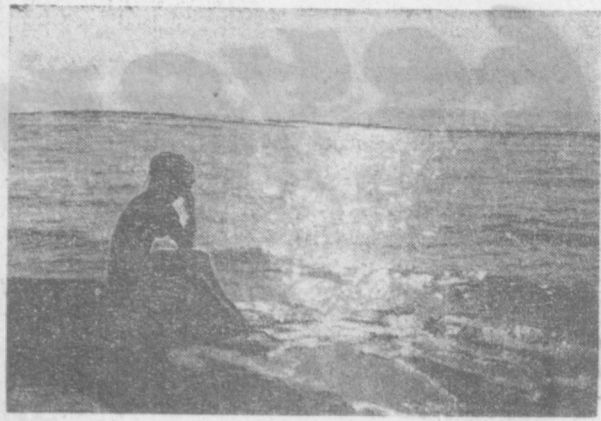
ХОРОША УТРЕННЯЯ ЗАРЯ НА ИССЫК-КУЛЕ