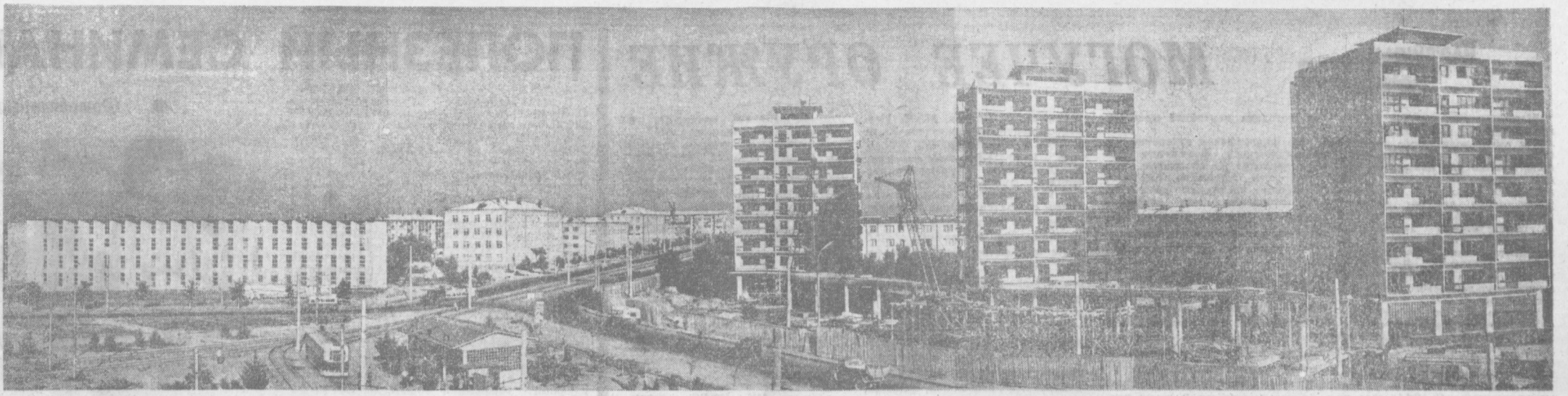
ТАШКЕНТ СЕГОДНЯ. Новый жилой квартал на Актепа.