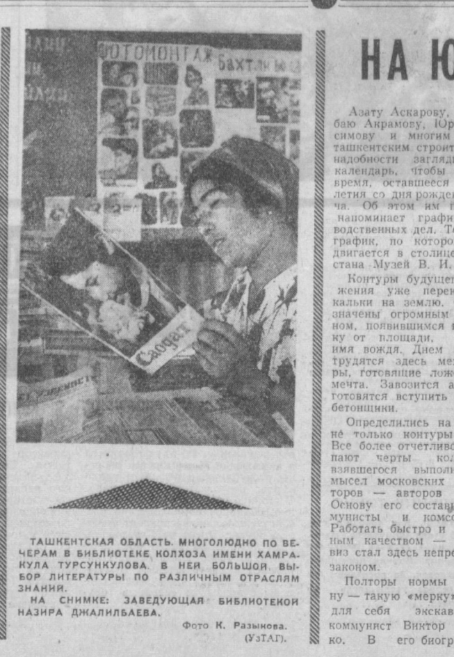
ТАШКЕНТСКАЯ ОБЛАСТЬ. МНОГОЛЮДНО ПО ВЕЧЕРАМ В БИБЛИОТЕКЕ КОЛХОЗА ИМЕНИ ХАМРАКУЛА ТУРСУНКУЛОВА В НЕЙ БОЛЬШОЙ ВЫБОР ЛИТЕРАТУРЫ ПО РАЗЛИЧНЫМ ОТРАСЛЯМ ЗНАНИЯ.

Так была озглавлена 23 июля в «Вечернем Ташкенте» заметка. В ней говорилось, что правление Дворца культуры железнодорожников еще не все сделало по улучшению культурного обслуживания трудящихся в субботние и воскресные дни.