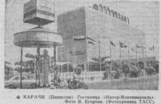
КАРАЧИ (Пакистан). Гостиница «Интер-Континенталь».

Находящийся в Белграде О. Шик освобожден от обязанностей заместителя председателя правительства ЧССР.