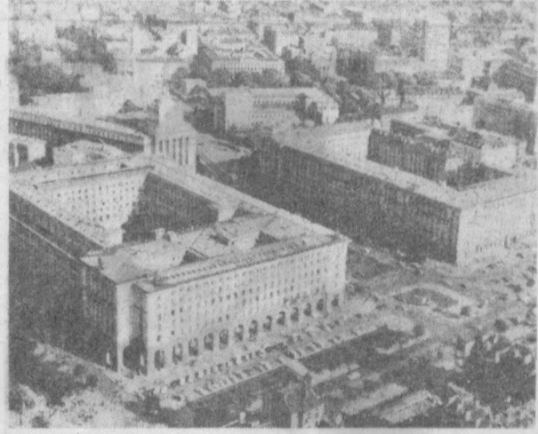
Центральная часть столицы Народной Республики Болгарии.