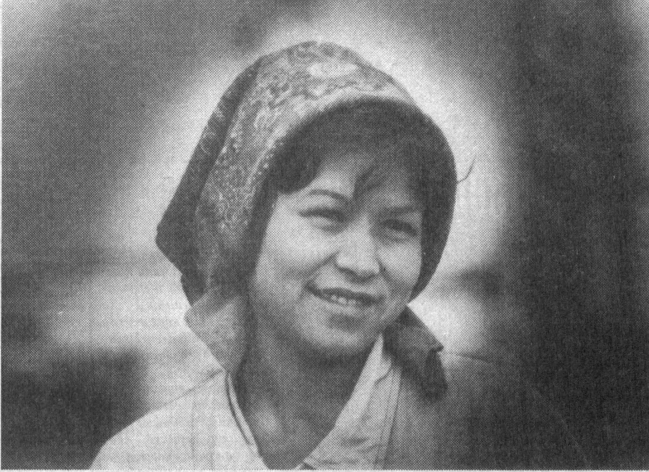
Сайхунбод туманидаги Оқолтин дон маҳсулотлари корхонасида қопларни таъмирлаш цехи ишга туширилади. Ҳозир бу ерда қўлаб хотин-қиз меҳнат қилмоқда. Уларнинг сай-ҳаракати билан бир кеча-кундузда 4-4,5 минг та қоп қайта таъмирланиб, корхона эҳтиёжи учун етказиб берилаяпти.

Утган йили Андижон шаҳридаги маъмурият қанчалар «Хумо» жамияти Пахтабод туманининг «Маданият» кишлоқда тикви