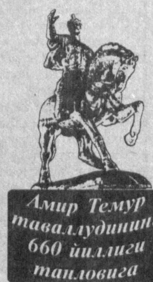
Амир Темур таваллудининг 660 йиллиги ташаббуси

Аждодларимиз томонидан яратилган бетакрор санъат ва маданият дурдоналарининг кўпчилиги қисми Британия музейида сақланади. Жумладан, 1497 йида Хусайн Бойқаро учун металлдан ишланган кўзача ва Мирзо Улугбекнинг номи ўйиб ёзилган нефрит қаҳақ музейининг энг ноёб буюмларидан.