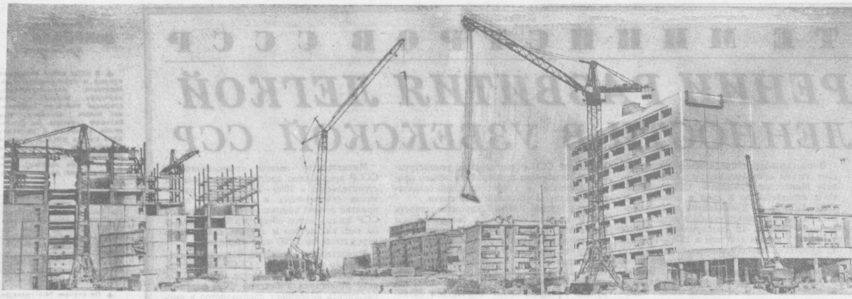
23 КВАРТАЛ ЧИЛАНДЗАРА. ЗДЕСЬ СТРОЯТ ВЫСОТНЫЕ ДОМА ПОСЛАНЦЫ ПОДМОСКОВЬЯ.