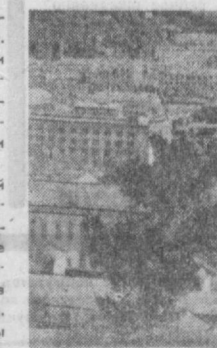
КОРЕЙСКАЯ НАРОДНО-ДЕМОКРАТИЧЕСКАЯ РЕСПУБЛИКА. НА СНИМКЕ: центр провинции Кансон — город Вонсан.

Собрание отправило поздравительную телеграмму в Пхеньян, в адрес Общества корейско-советской дружбы. (УзТАГ).