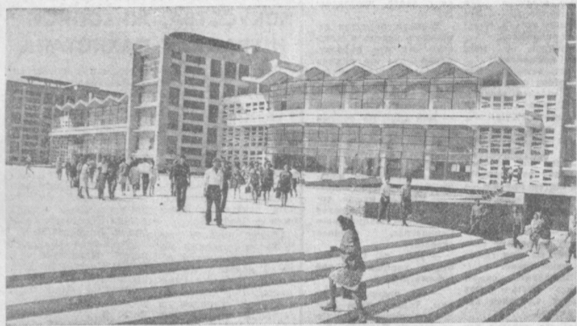
Новый комплекс учебных корпусов Ташкентского государственного университета имени В. И. Ленина украсил столицу Узбекистана.