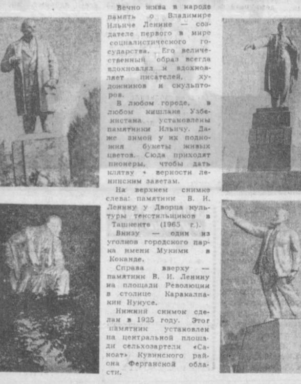
Вечно живая в народе память о Владимире Ильиче Ленине — создателе первого в мире социалистического государства. Его величественный образ всегда вдохновлял и вдохновляет писателей, художников и скульпторов.

В любом городе, в любом кишлаке Узбекистана установлены памятники Ильичу. Даже зимой у их подножия букеты живых цветов. Сюда приходят пионеры, чтобы дать клятву верности ленинским заветам. На верхнем снимке слева: памятник В. И. Ленину у Дворца культуры текстильщиков в Ташкенте (1965 г.). Внизу — один из уголков городского парка имени Мухоморова в Коканде. Справа: памятник В. И. Ленину на площади Революции в столице Каракалпакии Нукусе. Нижний снимок сделан в 1925 году. Этот памятник установлен на центральной площади сельхозартеля «Саят» Куванского района Ферганской области.