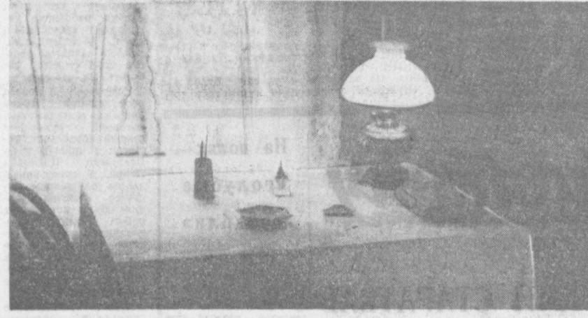
Рабочий стол в квартире Ильича.