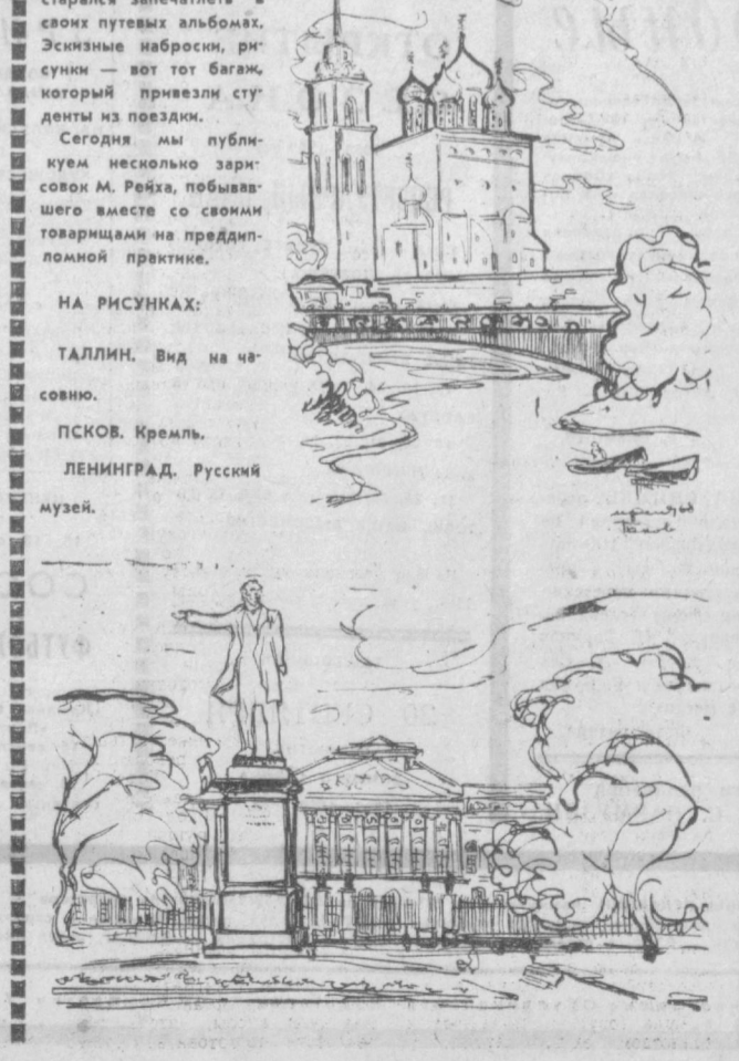
НА РИСУНКАХ: ТАЛЛИН. Вид на часовню. ПСКОВ. Кремль. ЛЕНИНГРАД. Русский музей.