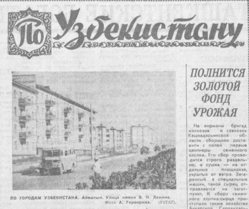
ПО ГОРОДАМ УЗБЕКИСТАНА. Алматы. Улица имени В. И. Ленина.