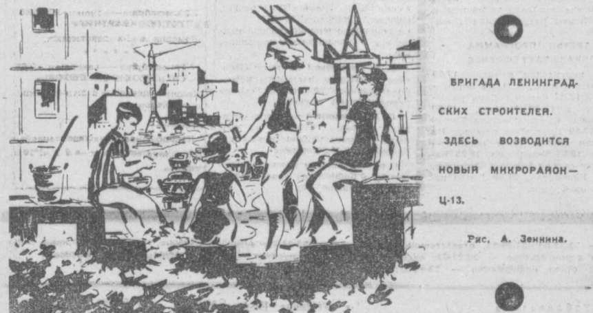
БРИГАДА ЛЕНИНГРАДСКИХ СТРОИТЕЛЕЙ. ЗДЕСЬ ВОЗВОДИТСЯ НОВАЯ МИКРОРАЙОН — 4-13.