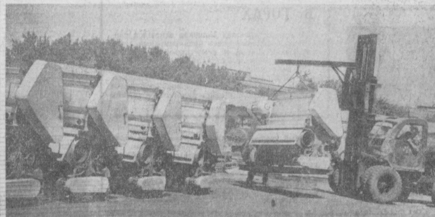
С погрузочных площадок машиностроительных предприятий Ташкента непрерывным потоком идет техника для труженников сельского хозяйства. НА СНИМКЕ: на погрузочной площадке завода «Узбекхлопкомаш» идет отправка на село кулачно-очистительных машин.

На днях колонна приступила к копке траншей для прокладки кабеля на линии Ботаническая — Астрономическая в Ташкенте. Строители приняли обязательство завершить эту работу на 25 дней раньше срока — ко Дню Советской конституции. Ввод в эксплуатацию новой магистрали значительно повысит надежность электроснабжения в Кировском и Куйбышевском районах.