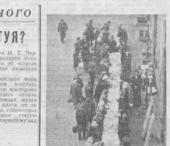
Книжный базар на проспекте Ленина в Петрозаводске.

Удается ли найти статую Ахилла и другие сокровища древнегреческого храма, воздвигнутого почти три тысячи лет назад на пустынной черноморском острове Змеиный? Ответ на этот вопрос должна дать экспедиция Одесского археологического музея, которая высадилась на острове Аквалантиста, египетологи обследуют подводные гроты, карьерные пещеры, морское дно вокруг острова. — В Европе нет другого такого же ценного для археологической науки острова, как Змеиный, — сказал корреспонденту