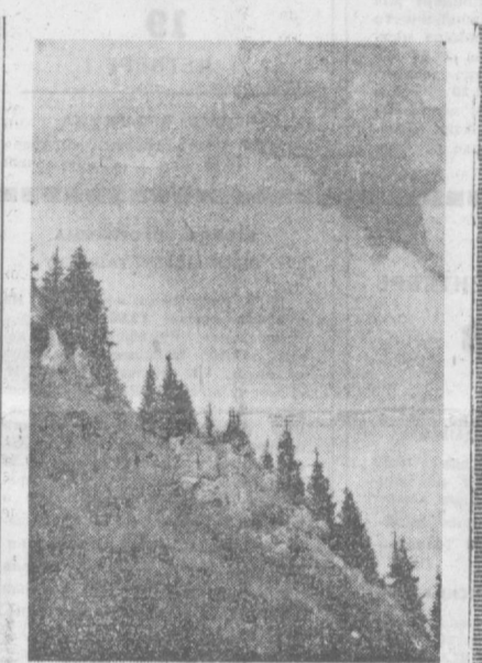
В ГОРАХ ТЯНЬ-ШАНЯ.