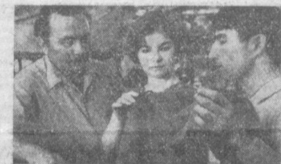
Ташкентская трикотажная фирма приступила к выпуску нового изделия — камелан из высокопрочного синтетического волокна.

Состоялось занятие постоянно действующего семинара инженеров-техников рабочих и новаторов производства предприятия «Узбекистан» имени В. И. Ленина. В семинаре приняли участие специалисты Ташкентского производственного объединения «Узбекистан», а также Самаркандского кожзавода.