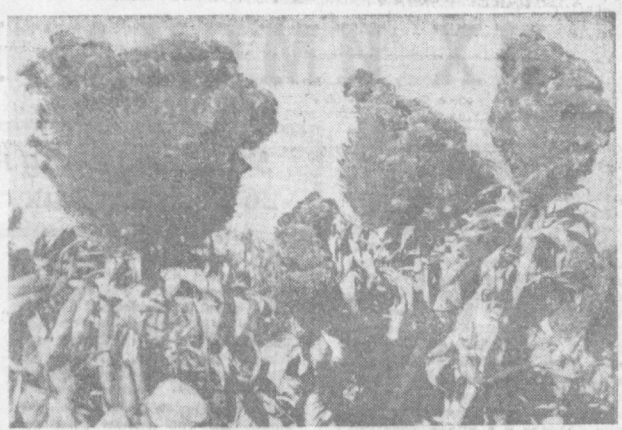
ЦВЕТЕТ ПЕТУШИНЫ ГРЕБЕШОК.

— Ладно, Феруз. Пойду я... Я проводил ее до двери. (Продолжение следует).