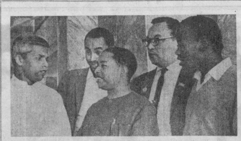
Группа писателей-участников симпозиума беседует в Музаре в перерыве между заседаниями.

не, где до Октябрьской революции литература издавалась лишь на немногих языках. Это — свидетельство подлинной культурной революции, происшедшей в жизни советских народов. Оратор называет имена крупнейших писателей союзных республик, обогащаю-